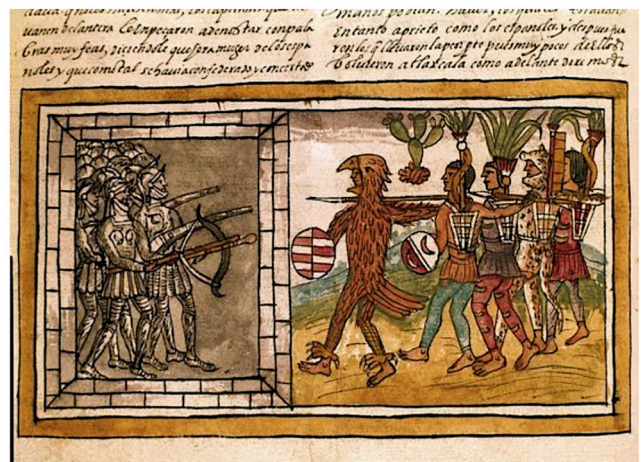
Document 4 : Les Espagnols face aux Aztèques (Codex Duran, XVI e siècle, Paris)

Hernan Cortès (1485-1547), Histoire de la conquête du Mexique , III, 11.